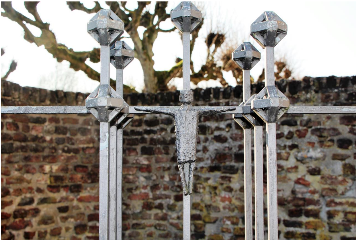
Skulptur / Kreuz vor der Basilika (neben dem Ostchor)

Mitgliederinformation 01/2018 vom 22. März 2018